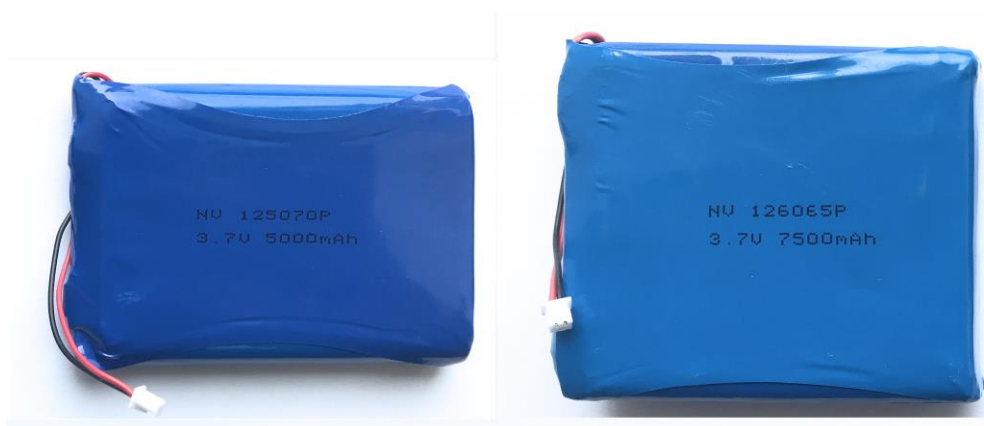
Рисунок 5. АКБ для CarGo Spy та CarGo Spy Plus

* Для зарядки пристрою потрібно використати блок живлення 5 або 12В, 1А, з роз'ємом micro usb. В комплект поставки не входить.