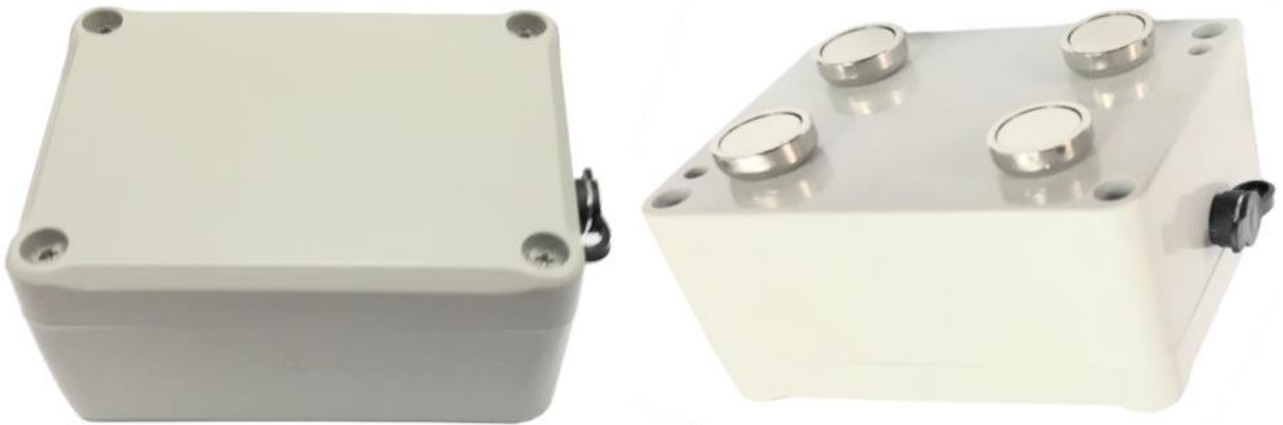
Рисунок 2. Зовнішній вигляд Cargo Spy Plus

Примітки: як опцію на корпус може буде змонтовано мембранну клавіатуру для передачі повідомлень по натисканню на неї.