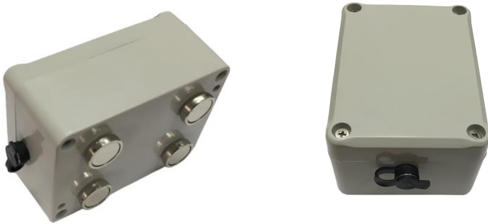
Рисунок 1. Зовнішній вигляд Cargo Spy