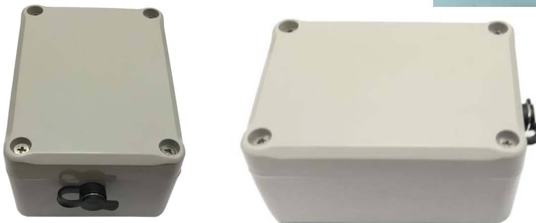
Рисунок 4. CarGo Spy та CarGo Spy Plus в зборі