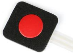
Рисунок 1.1 Зовнішній вигляд додаткової клавіатури

Примітки: як опцію на корпус може буде змонтовано мембранну або іншу клавіатуру для передачі повідомлень по натисканню.