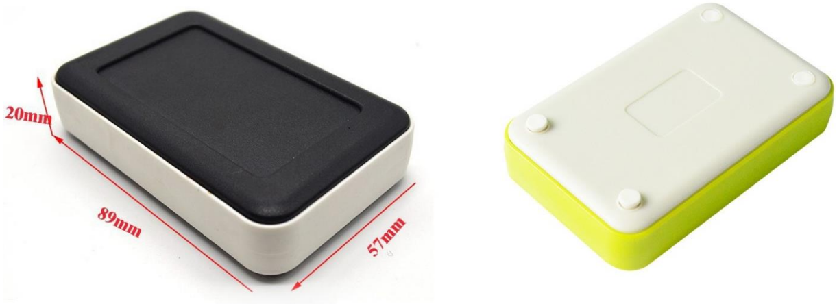
Рисунок 1. Зовнішній вигляд Cargo Unit